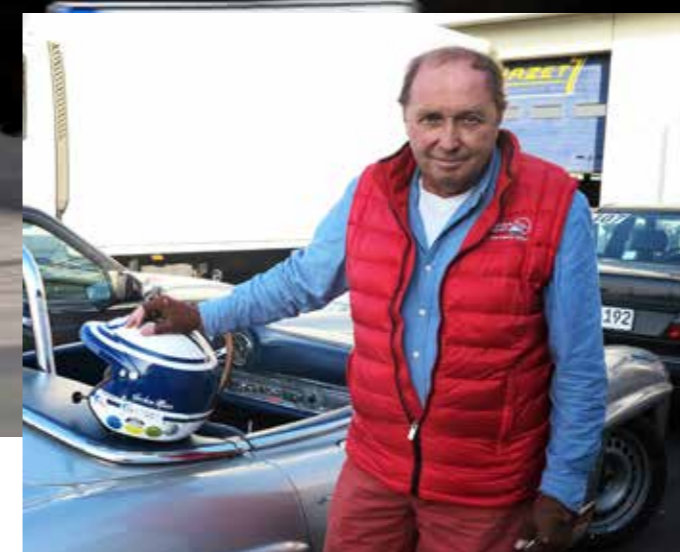
Rennsport-Legende und Scuderia Hanseat Fahrercoach Jochen Mass